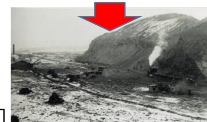
<崩された後の丸山>