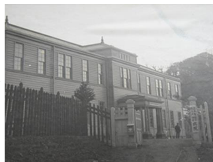
<日本製鋼所職工共済会>

従業員が増えたことによって医療施設が必要となり、私立薬生病院ができた。その後、工場以外の人もみてあげるようになって、日本製鋼所職工共済会病院となり、今日の日鋼記念病院のもとになった。