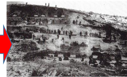
<段々に崩す作業現場>